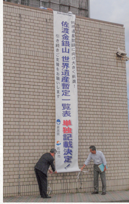
2010年 世界遺産暫定リスト単独記載