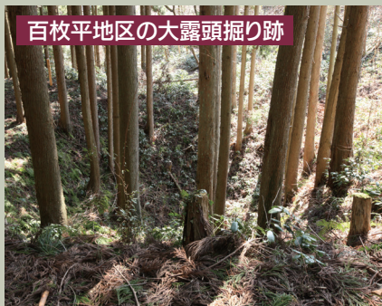
百枚平地区の大露頭掘り跡

から来た山師によって「坑道掘り」が伝えられ、複数の鉱脈の同時採掘や坑内の排水が可能となり、銀の産出量が飛躍的に増加しました。また、採掘・選鉱・製錬等、分業化がすすめられ作業効率が高められました。これにより銀を求めて多くの鉱山労働者が各地から集まり、鉱山労働者の町や、物資を搬入する港が整備され、「鶴子干軒」といわれる繁栄期をむかえました。鶴子銀山の発見・開発は、島内の鉱山開発に大きな影響をあたえ、やがて相川で大規模な金銀鉱脈が発見されるきっかけとなりました。