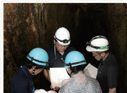
2023年 金の道ラッピングバス