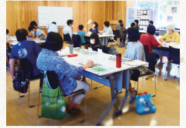
2020年 きらりうむ佐渡ワークショップ