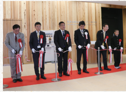
2019年 きらりうむ佐渡オープン