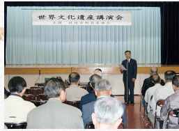
2006年 世界文化遺産講演会