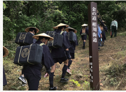
2019年 御金荷の道ウォーク