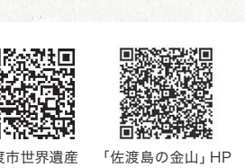
2023年 佐渡金銀山音声ナビ開始