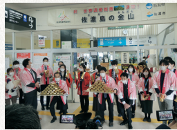
2022年 推薦決定イベント