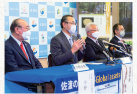
2022年 推薦決定記者会見