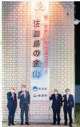
2022年 ユネスコ世界遺産へ推薦